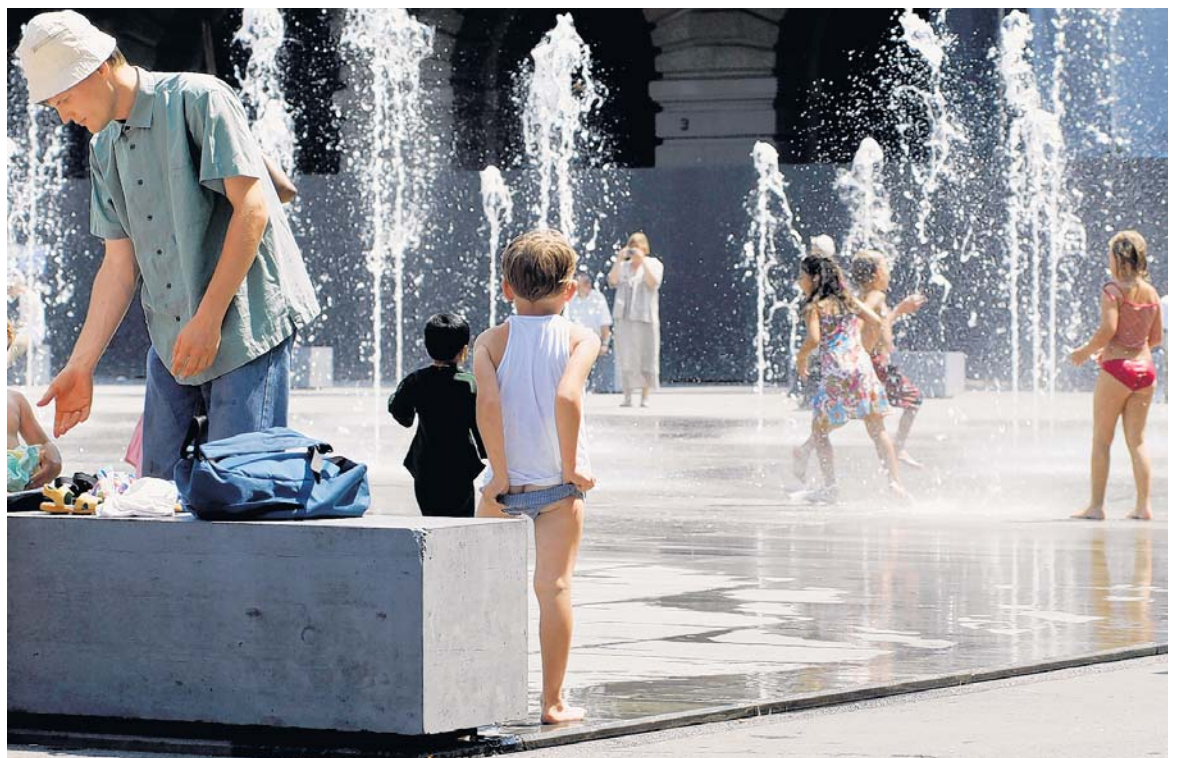
Quader-Provisorium. Kindern und Eltern gefallen die massiven Betonelemente auf dem Bundesplatz.

19 BETONBLÖCKE. Vor einigen Tagen dann die Überraschung: 19 Betonquader, jeder 800 Tonnen schwer, lässt das Bundesamt für Bauten und Logistik auf den Platz karren und auf der Bundeshausseite platzieren. Der viel gelobte «Platz der gestalteten Leere», der erst kürzlich mit dem «Honor Award for Urban Design» des American Institute of Architects ausgezeichnet worden ist, ist damit optisch ruiniert – und jeder Quader seither mit Beschlag belegt, von sitzend picknickenden, lesenden, dösenden, strickenden, seligen Menschen. Was das Amt mit dieser Aktion bewirken wollte? Weder einen Aufstand der Berner Stadtregierung noch die Durchsetzung des Rechts auf einen anständigen Sitzplatz, sondern lediglich den Schutz der teuren Gneisplatten und der Fussgänger. Denn die Bundeshausanierung ist gestern in ihre Intensivphase getreten. Es soll verhindert werden, dass wegen der Verengung der Amtshausgasse die Autos auf den