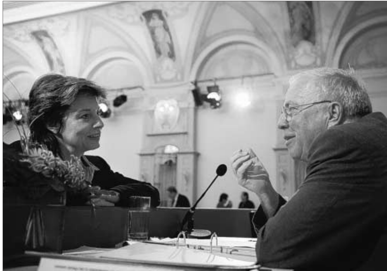
FÜR EINMAL EINIG Anita Fetz und Justizminister Christoph Blocher wollten eine Gewährleistung ohne Vorbehalt.

Kantonsverfassung Ständerat sagt Ja, Minderheit «zeigt gelbe Karte»